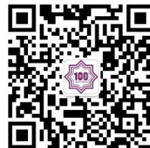
南开 MBA 中心官方微信号