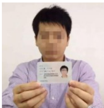
图三：考生验证图例

考生进入候考区后，按照系统提示完成设备调试，然后需向面试助理 出示身份证件和初试准考证 ，再次进行身份信息核验，考生手持身份证并确保与本人面部同框，以确保与照片和身份证清晰比对（如图三）；上报面试地点、核对预留应急电话；与面试助理互动测试音视频功能；根据考试工作人员的指令，手持摄像头，环绕 360° 展示本人应试环境，以确定是否符合要求；然后考生根据系统提示和面试助理要求静候面试邀请的发出。面试助理会通过群发消息或私信两种方式对候考考生发送信息，督促考生再次调试设备，确保复试顺利进行。